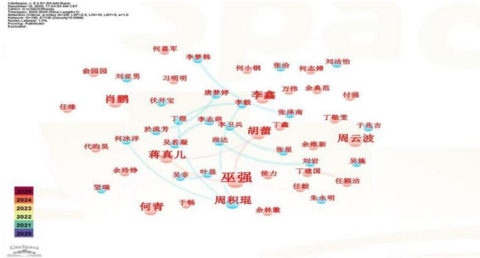
图 2 制造业数字化转型领域作者共现网络图

作者共现图谱中节点 199 个、线段 136 个，网络密度 0.0069。巫强、蒋真儿[1]等为领域核心研究者，分别聚焦制造业数字化转型路径机制、绿色创新与企业绩效关联；李鑫、周云波[2]等学者的研究围绕数字化转型异质性展开，与本文产权异质性分析主题呼应。作者合作网络呈现“小聚集、大分散”特征，跨群体、跨方向协作较少，存在明显“孤岛”现象，虽利于细分方向深度挖掘，但限制了跨领域融合研究，后续需加强不同研究团队联动。