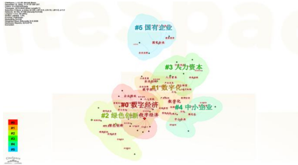
图 4 制造业数字化转型领域关键词聚类图谱